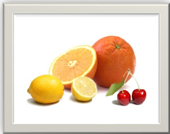
Composición 2: Si hay UNIDAD

2.- EQUILIBRIO : una composición debe tener equilibrio, existen dos tipos de equilibrio