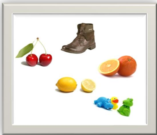
Composición 1: No hay UNIDAD

1.- UNIDAD : básicamente es la forma en que se relacionan, e integran los objetos o formas que se van a utilizar al momento de crear una composición, tiene que apreciarse una relación entre las formas que aparecen en la composición.