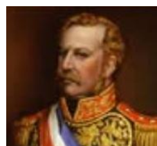
Presidente de la República Manuel Bulnes (1841-1851)