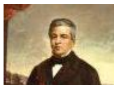
Presidente de la República Manuel Montt (1851-1861)