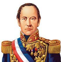
Presidente de la República José Joaquín Prieto (1831-1841)